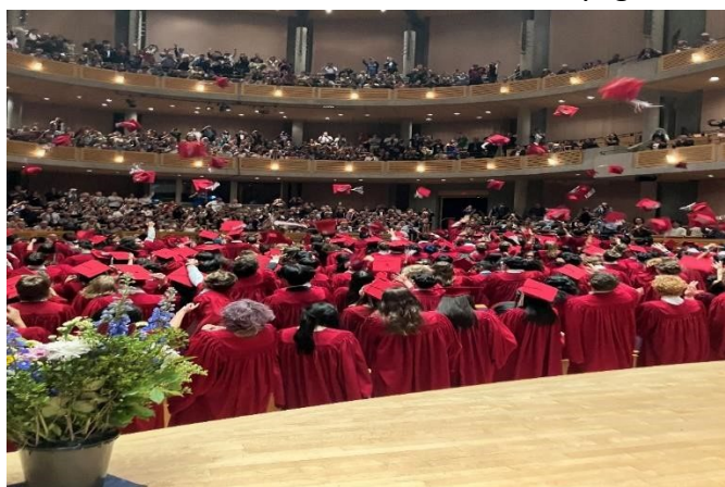
图 1 毕业生在经历了一个令人惊奇的下午的认可和庆祝后，将帽子抛向空中!