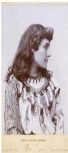
E Pauline Johnson

(Takehionwake) 是莫霍克酋长和白人母亲的女儿。宝琳·约翰逊 (Pauline Johnson) 是一位著名的加拿大作家，她记录了斯阔米什酋长乔·卡皮拉诺 (Joe Capilano) 在温哥华报纸《每日省》(The Daily Province) 上告诉她的传说。这些著作后来被转移到一本书和网站上： https://www.legendsofvancouver.net/ 《温哥华传奇》。