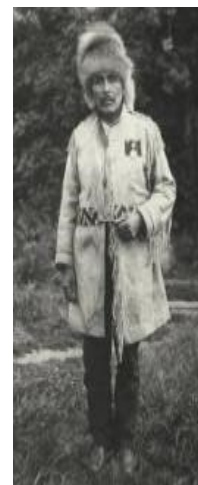
Chief Joe Capilano

How do we build student curiosity and imagination in the process of lifelong learning?