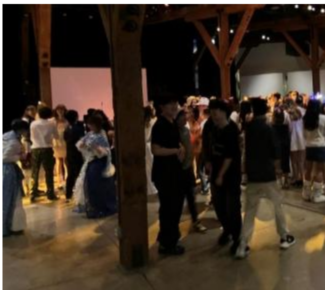
图 2 当晚的主要亮点之一是化妆舞会!!